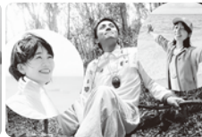
あおみどり(歌、音楽、表現活動等)