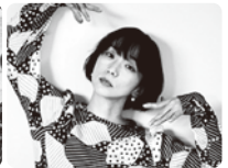
康本雅子(ダンサー・振付家)