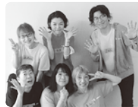
Ten seeds(劇・あそび・表現活動)